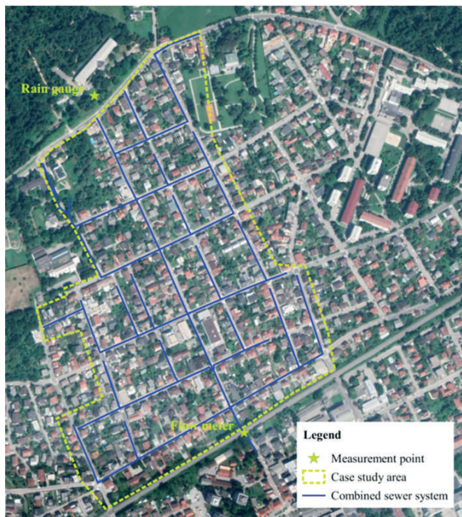
Slika 1: Obravnavano območje v Rožni dolini, Ljubljana.

V okviru doktorske raziskave (Radinja, 2022) je bila z namenom učinkovite avtomatizacije dveh kompleksnih nalog na področju urbane odvodnje, to sta kalibracija modelov površinske odvodnje in enokriterijska optimizacija ukrepov za obvladovanje padavinskih voda, zapisana domenska knjižnica znanja, ki omogoča uporabo orodja »Process-Based Modelling Tool« (ProBMoT). Za testno območje v Rožni dolini, Ljubljana (Slika 1), je bilo z orodjem ProBMoT načrtovanih 6 scenarijev ukrepov za obvladovanje padavinskih voda: bioretenzijske enote, deževni vrtovi, zelene strehe, infiltracijski jarki, suhi zadrževalniki in zadrževalni bazeni. Namen je bil zmanjšanje konice in skupnega volumna odtoka iz prispevnega območja glede na ciljni odtok; na primer enourne padavine s povratno dobo 25 let lahko povzročijo odtok, značilen le za enourne padavine s povratno dobo 5 let. Razliko zadržijo dimenzionirani ukrepi.