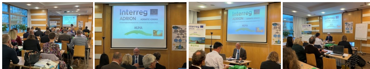
Uvodni nagovori veleposlanikov iz Slovenije, Hrvaške, Italije in Grčije