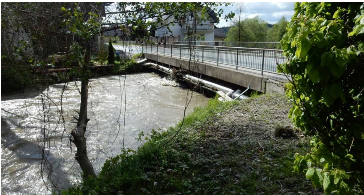
Zaradi poplave ogrožena vodovodna cev na mostu v Kamniku