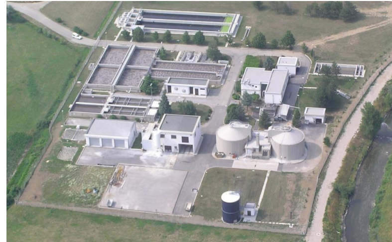
Čistilna naprava Ajdovščina