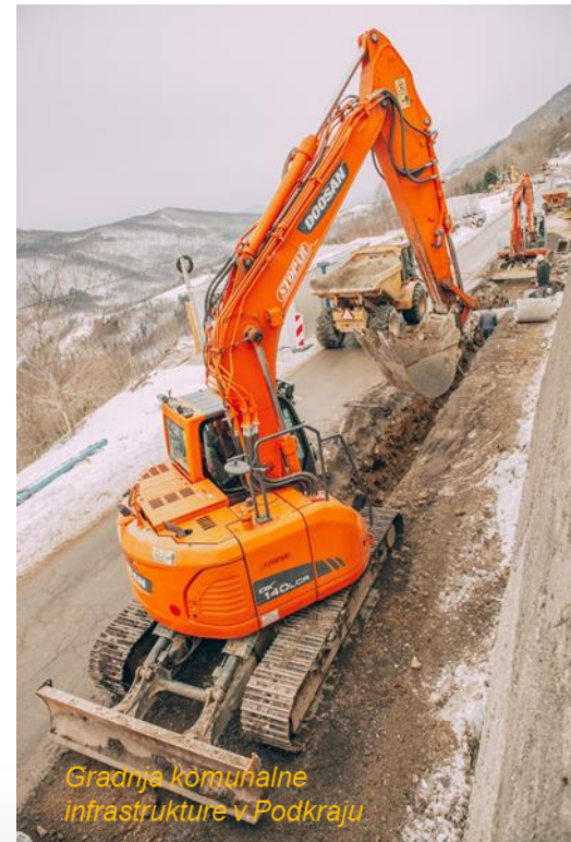
Gradnja komunalne infrastrukture v Podkraju