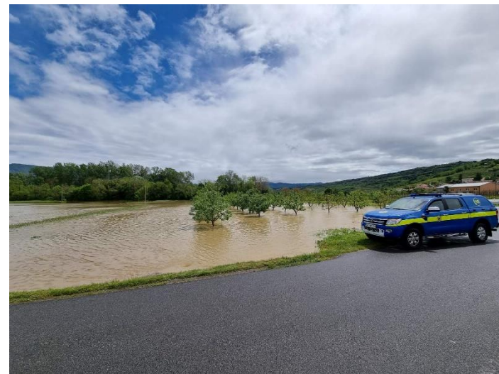
Poplavljenno območje v Veliki Žabljah