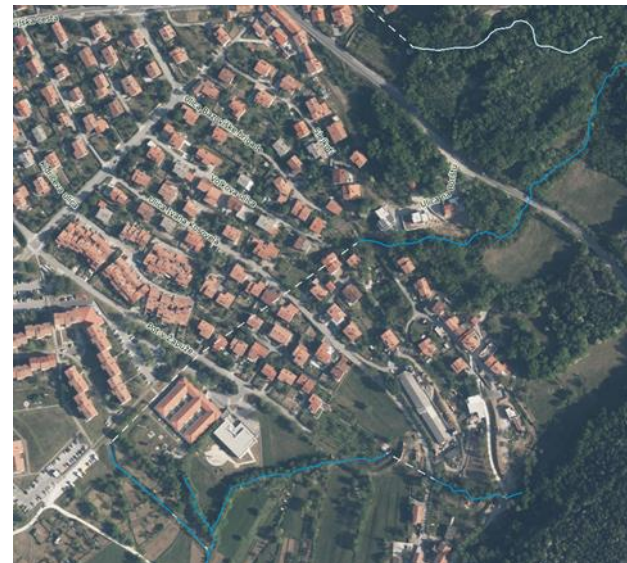
Kataster vodotoka